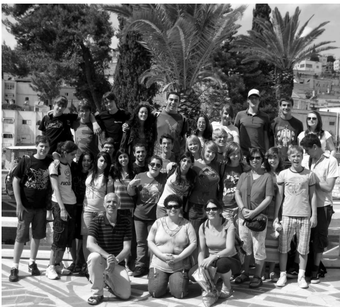
Dürener Jugendlichen gemeinsam mit ihren israelischen Gastgebern.

Kernpunkt des Austauschprogramms war der Aufenthalt in den Gastfamilien. Hier konnten die jungen Dürener anknüpfen an bereits viele Kontakte, die es seit 1987