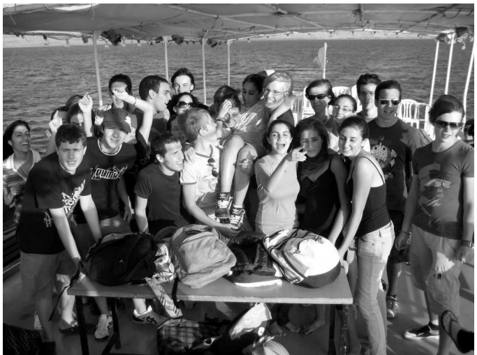
Die Stimmung an Bord ist bestens – hier die Dürener Jugendlichen gemeinsam mit ihren Partnern aus Nesher bei einer Bootstour