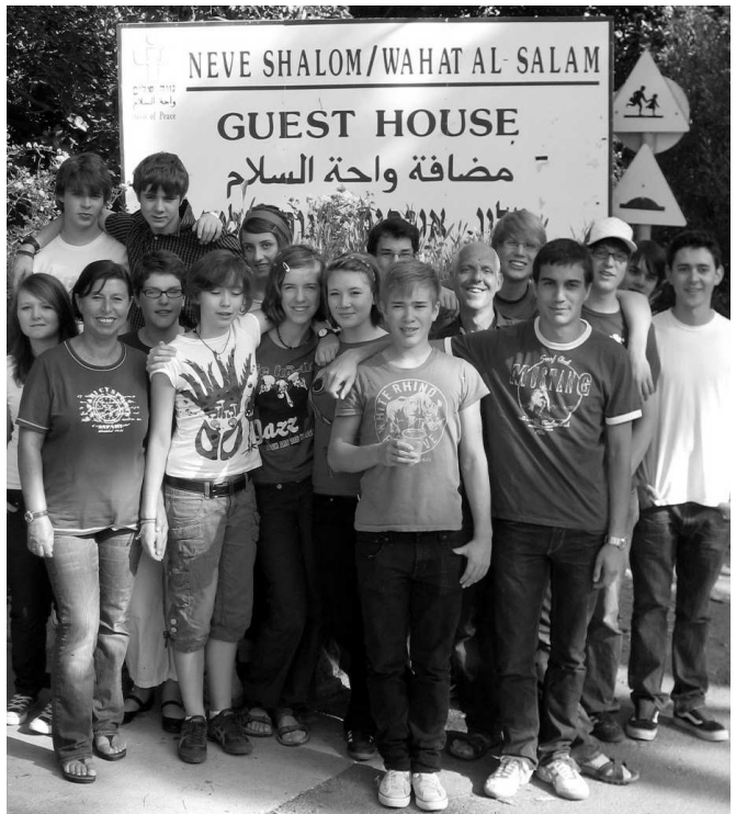
Die Dürener Jugendlichen besuchten auch das Friedensdorf Neveh Shalom/Wahat AL-Salam

Salam. In diesem Dorf leben jüdische und palästinensische Bürger Israels friedlich miteinander in einer Gemeinschaft, die auf Toleranz, gegenseitige Achtung und Zusammenarbeit beruht. Das Dorf hat eigene Schulen, in denen jüdische und palästinensische Kinder